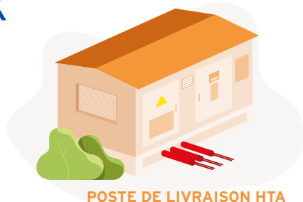
POSTE DE LIVRAISON HTA

1 • DEMANDE DE RACCORDEMENT (disponible sur geredis.fr )