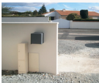
Coffret côté privé