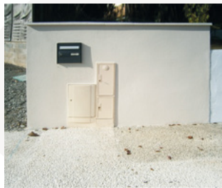
Coffret côté domaine public

Ces dernières prennent contact avec vous avant la réalisation.